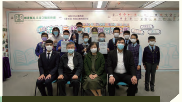
第八屆「法制先鋒」法律常識問答比賽 2020.12

透過廣播劇、瓷片畫、南區水上圖、菲林照片、環保 聖誕樹等與大家分享南區居民與青年藝術家的作品