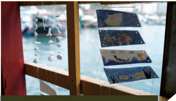
「復刻南區計劃」藝術在南區 社區藝術提案展覽 2020.12

與本地塑膠升級再造團體，以地球號太空船為 靈感來源，以升級再造回收膠作為主要素材， 引發大家對未來可持續發展的關注及想像