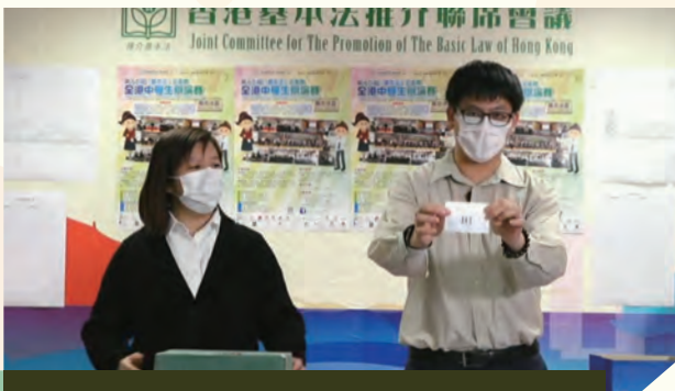
第十九屆《基本法》多面體全港中學生辯論賽 2020.12

透過緊張刺激的問答比賽，加深市民、青少年和中、 小學生對國家憲法、基本法及香港法律的認識， 讓他們進一步了解一國兩制及法治精神。