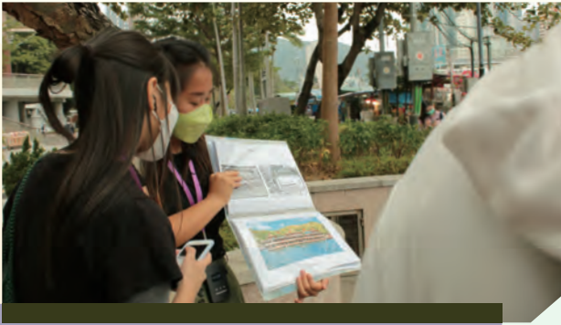
"BODW城區活動2020：主要伙伴場地 創意節 - 香港仔社區異想" 2020.12

這次創意節致力引導青年深層次認識及連繫社區， 透過不同活動，發揮青年的文藝創意， 激發青年對香港仔社區的異想