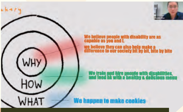
教大教育與社會企業家基金分享 2020.6.18 分享社創經驗及創業建議，鼓勵年青人投身社會創業