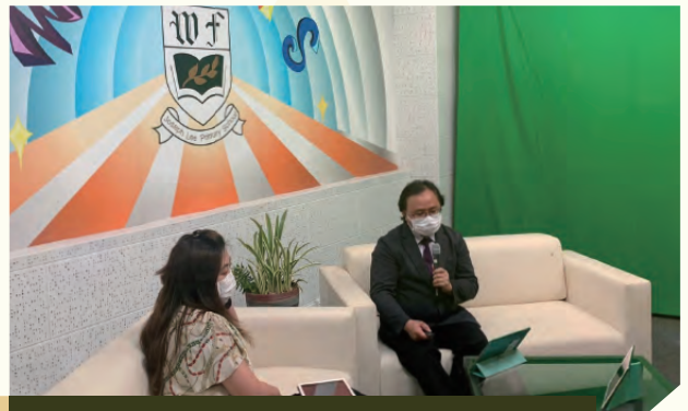
小五家長晚會 2020.6.19 因疫情關係，透過網上直播軟件進行家長晚會