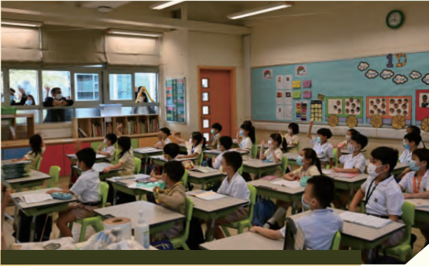
初小迎接復課 2020.6.15 校長復課後到課室視察上堂情況