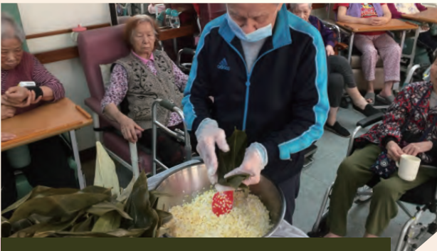
端午包粽活動 2020.6.23 院友透過端午節歷史及包粽體驗懷緬從前生活點滴，回味昔日情懷