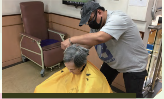
頌恩髮廊 2020.6.15 剪髮義工來到院舍為院友修剪頭髮