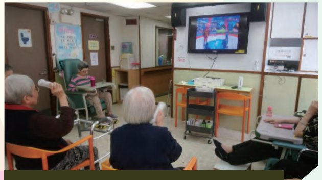
遊戲同樂日 2020.6.26 院友試玩年青人常接觸的電子遊戲，親身感受當中樂趣，亦可鍛鍊手眼協調